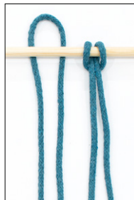
Kuva 2 Kaksoistasosolmu = KTS