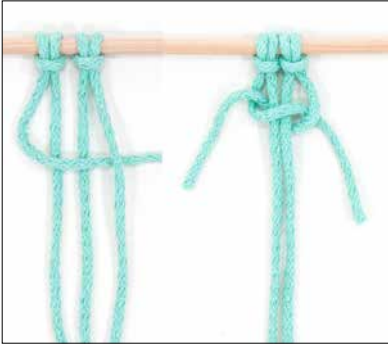
kuva 2, KTS, vaihe 1