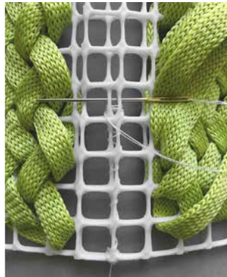
6. Verkon yhdistäminen renkaaksi