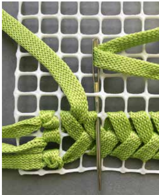
5. Kolmas pistorivi