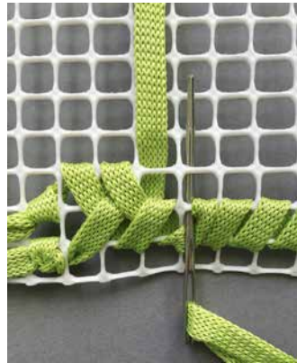
3. Toinen pistorivi