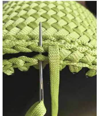
8. Pohjan kiinnitys

Mallien kaupallinen hyödyntäminen kielletty.