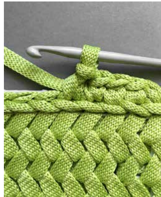
7 A. Alareunan ps-kerros, 7 B. Alareunan ks-kerros