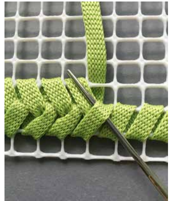
4. Kuteen suoristaminen