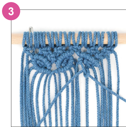
Sakara oikealle viistoon

Mallien kaupallinen hyödyntäminen kielletty.