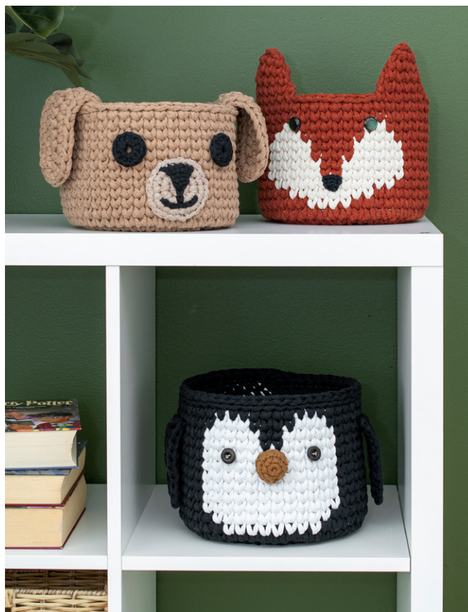
Katso myös Koira- ja Pingviini-korien ohjeet.

2. krs: 7 ns terralla, 8 ns valkoisella ja terralla krs loppuun. Muista vaihtaa väriä aina viimeisen s:n lopussa.