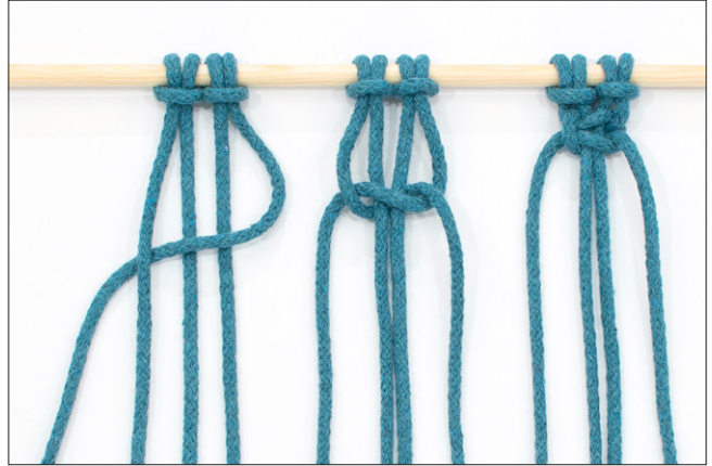
Kuva 2, KTS, vaihe 2