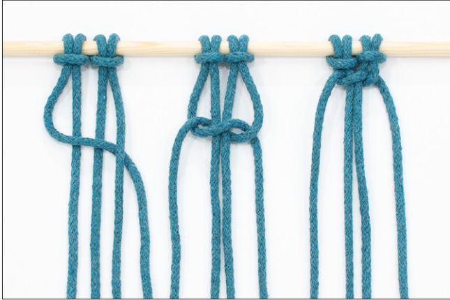
Kuva 1, KTS, vaihe 1