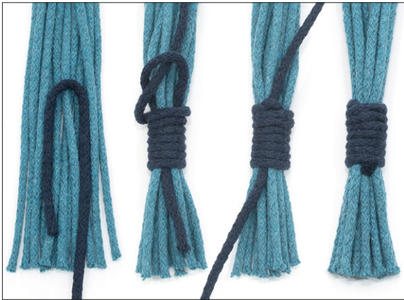
Kuva 3, kääresolmu