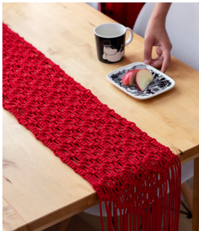
KTS vaihe 1

Mallien kaupallinen hyödyntäminen kielletty.