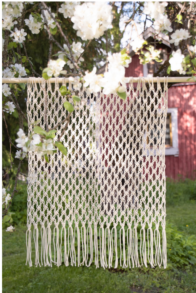
Kuva 1 Kaksoistasosolmu = KTS

28. krs: Tee silmusolmut neljällä langalla näin: *Ota oikealta 3 lankaa oikeaan käteen ja pidä ne suorina, vie vasemmalle jäänyt lanka etukautta kolmen langan yli, siitä lankojen takaa takaisin vasemmalle ja silmukan läpi eteen, kiristä solmu*, toista *-* vielä kerran. Tasoita lopuksi hapsut.