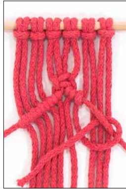
Kuva 3: kohosolmu oikealle viistoon