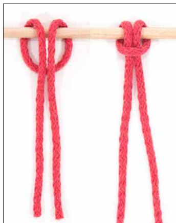
Kuva 1: surmansilmukka