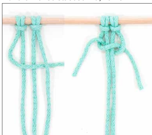
Kuva 3: kaksoistasosolmu, vaihe 1