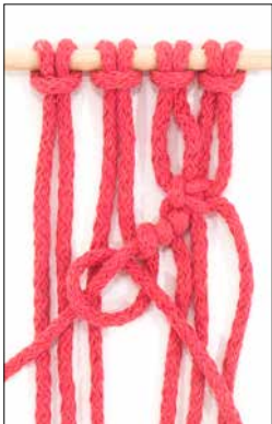
Kuva 3: kohosolmu vasemmalle viistoon