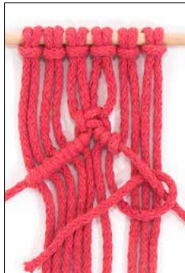
Kuva 4: kohosolmu oikealle viistoon